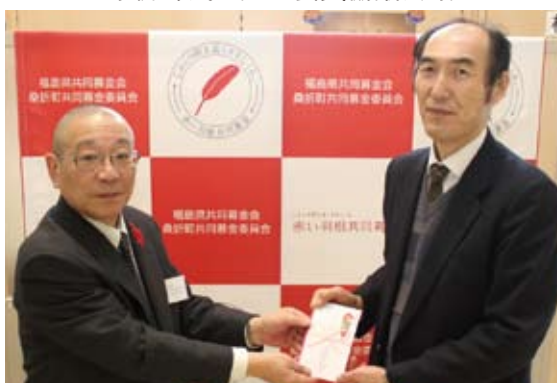
聖光学院高等学校 様