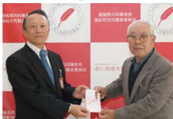
桑折町老人クラブ連合会 様