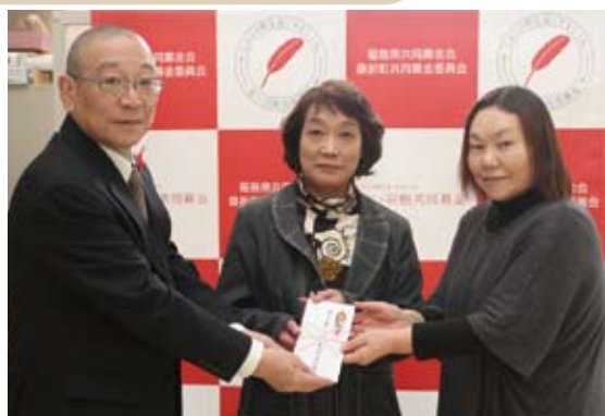
桑折町連合婦人会 様