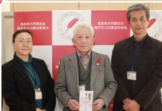
桑折町民生児童委員協議会 様