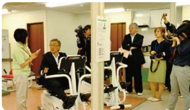
6月1日開所式では、来賓のみなさんにもマシンを体験いただきました。