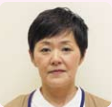
担当地区 桑折町 桑折町 桑折町 担当地区 桑折町 桑折町 桑折町

疑問を感じる点もありますが、先輩民生委員の方々に聞き、相談しながら、任期を全うしていきたいと思えます。自分もいつの日かお世話になるかもしれないから。