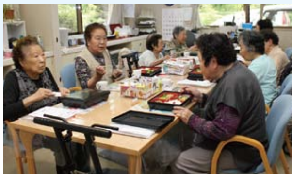
おしゃべりしながら楽しい昼食

4月から桑折町総合事業の通所型サービスの事業所として始めました。大かや園の大浴場で入浴タイム。ふらっとさんのおいしいお弁当も大変好評です。