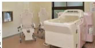
寝たきりの方でも安心して入浴ができます。

中重度の利用者様が安心してご利用できるよう特殊浴槽を完備し、毎日看護師、機能訓練指導員を2名配置しております。