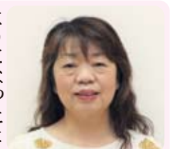
担当地区 桑折町 桑折町 桑折町 担当地区 桑折町 桑折町 桑折町

うな気がします。そんなときも諸先輩方のご支援やアドバイス等をいただきました。主に活動は一人暮らしの方のお宅訪問で、元気で生活されているか、困りごたないかを確認し、行政の橋渡しを行っております。