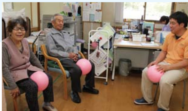
利用者のニーズに合わせて機能訓練を実施しています。

4月から個別機能訓練を開始しました。一般浴のお風呂を完備しております。定員11名のため、アットホームなデイサービスで、季節の行事等にも力を入れております。