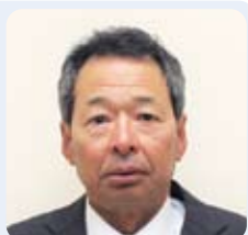
担当地区 桑折町 桑折町 桑折町 担当地区 桑折町 桑折町 桑折町

一人暮らしの人のところへ安否確認と体調管理のために、月に1度伺うと、「この地域で知っている人が民生委員だと心強く安心だ」と言われ、なんだか嬉しくなります。