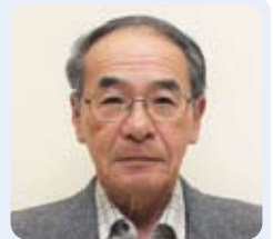
担当地区 桑折町 北町・佐藤 担当地区 桑折町 桑折町 桑折町 担当地区 桑折町 桑折町 桑折町

役をうけてしまったな、と思いましたが、高年齢者等の方々と話をしているうちに、これは必要な役なんだと思いはじめました。ことわざを思い出したのです。「情けは、人のためならず」…人に情けをかけるのは、その人の為となるばかりでなく、やがてめぐりめぐって自分に返ってくる。人には親切にせよという教えです。