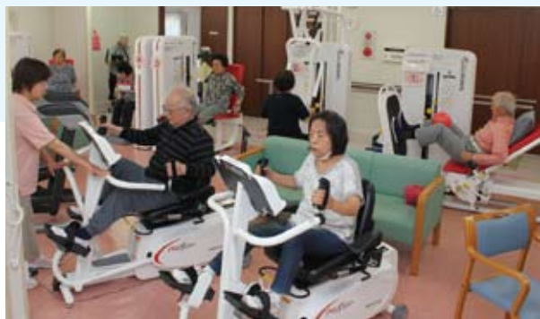
定期的にパワーリハビリを実施することが大事です。

最新のパワーリハビリの機器を導入し、パワーリハビリ及び機能訓練に特化したサービスを提供しております。