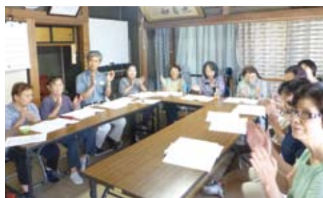
サロンの様子 (和みの会・陣屋)