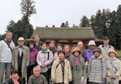
10月 シニアいきいきのつどい