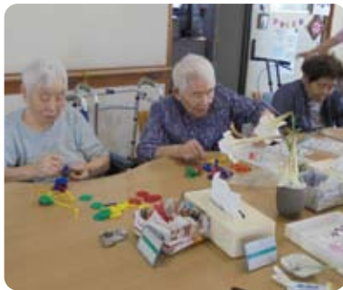
機能訓練はいろいろなメニューをご用意しています。