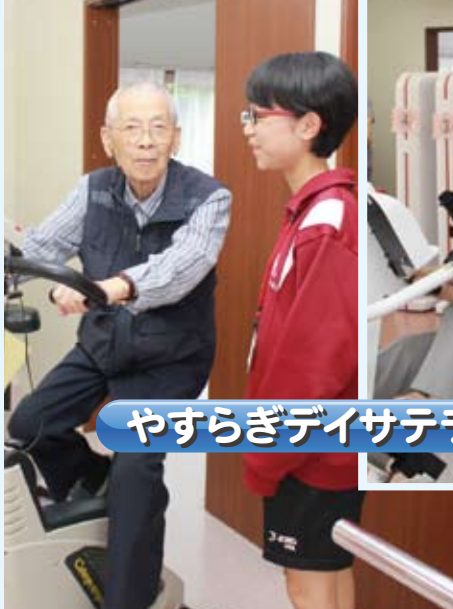
やすらぎデイサテライトもんも