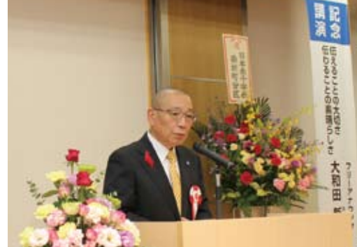
10月 法人設立40周年記念式典