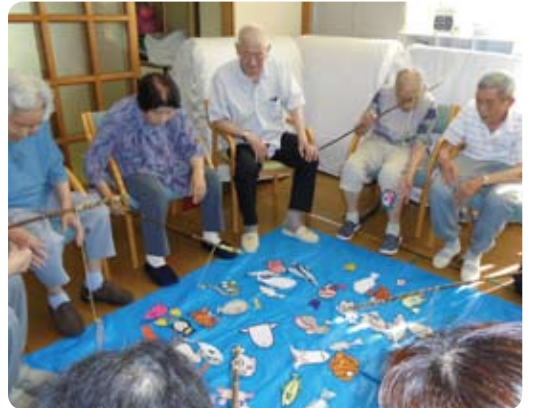
魚釣り大会、皆さん必死です。