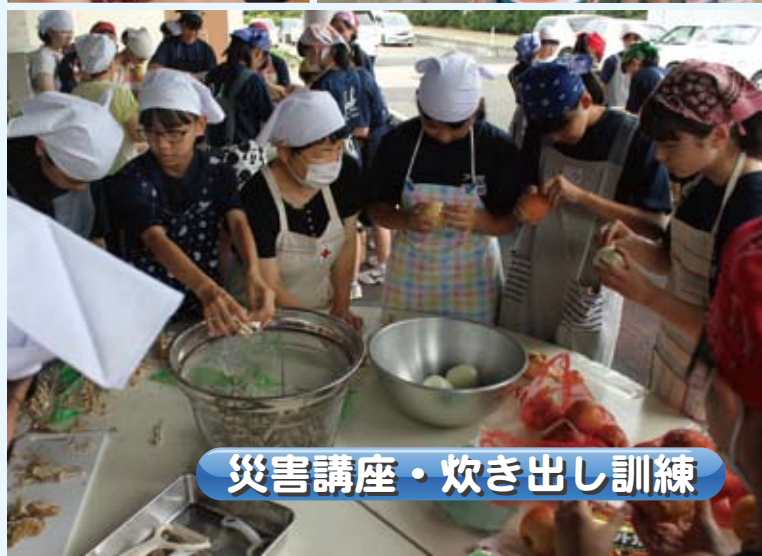
災害講座・炊き出し訓練

ボランティアはみんなを笑顔にすることができるので、とても大切なことだと学びました。施設の方にやさしく教えていただき、本当にありがとうございました。またみんなを笑顔にする活動をしてみたいです。