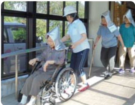
避難訓練を実施しました。