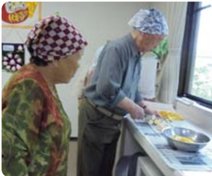
みなさんでおやつ作りを楽しみました。盆踊は笑い声が絶えませんでした。