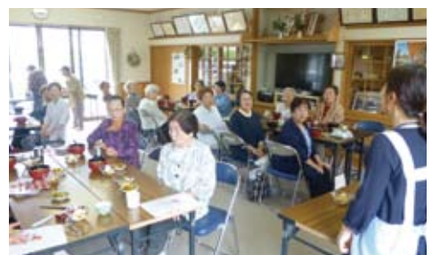
サロンの様子 (サロン追分)