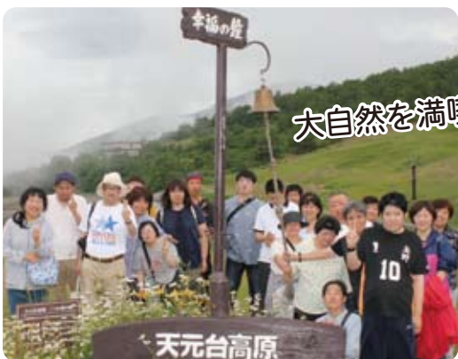
7/8天元台へ行ってきました。曇り空でしたが、みなさん思い思いに楽しんでいました。