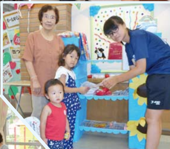
桑折聖・オリーブの郷夏祭り