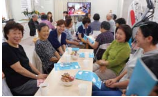
みなさんで歌を歌ったり、楽しいひと時を過ごしていただきました。