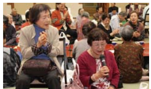
シニアいきいきの集い