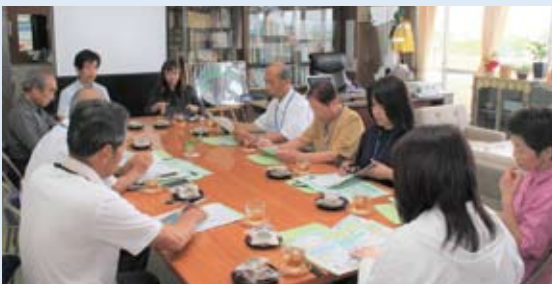
半田醸芳小学校にて