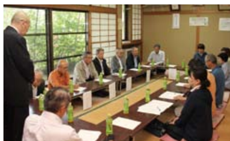
大かや園デイ運営推進会議