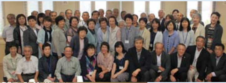
新発田市民生委員のみなさんと記念撮影

6月21日・22日、新潟・山形方面へ視察研修を開催いたしました。新潟県新発田市民生委員協議会の委員の方々と懇談会を実施し、有意義な視察研修となりました。