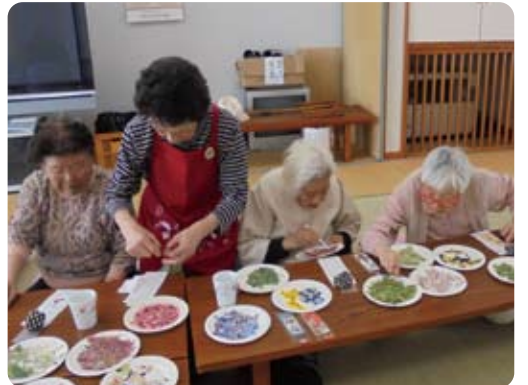
桃の郷押し花クラブの方を招いて押し花しおりづくりをしました。