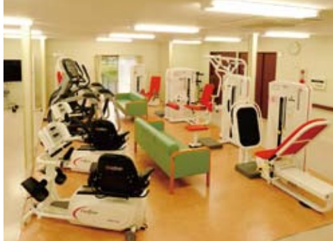
6月 もんも館最新機器