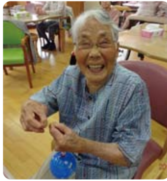
水ヨーヨー釣り大会。みなさんとても楽しんでくださいました。