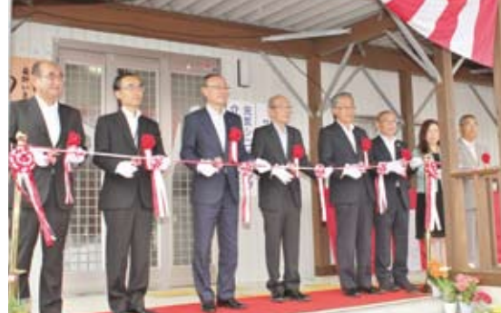
29年6月 もんも館オープン