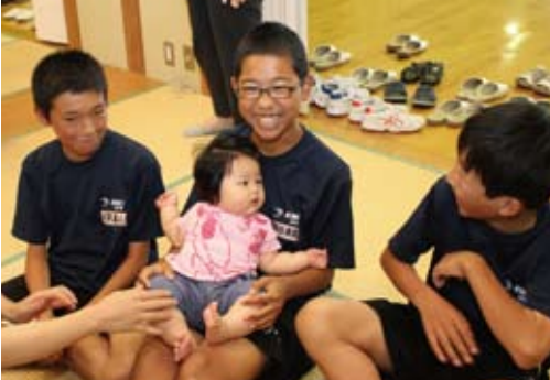
7月 サマーショートボランティア