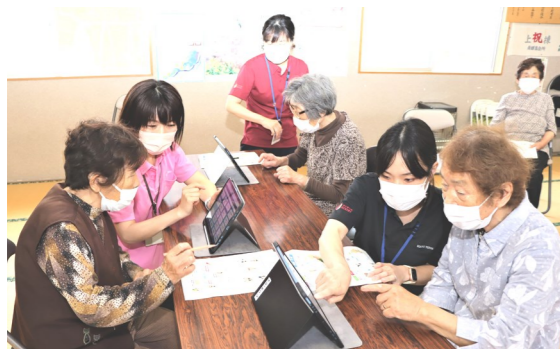
初めてのタブレットゲーム

日 時 令和5年8月29日(火) 10：00～11：30 場 所 桑折公民館 会 費 飲み物代 100円 ＜問い合わせ先＞ 桑折町地域包括支援センター ☎024-582-1188