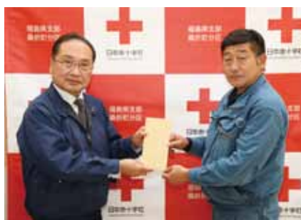
株式会社一心総業 様