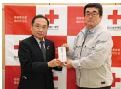
桑折町建設業連合組合 様