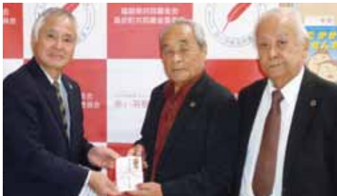
桑折町老人クラブ連合会様