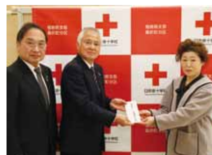
高橋縫製有限会社 様