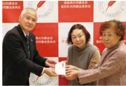
桑折町創生婦人会様