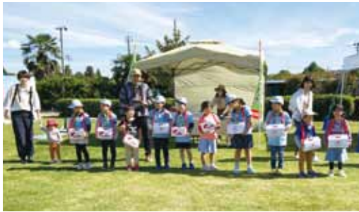
ボーイスカウト桑折第1団様