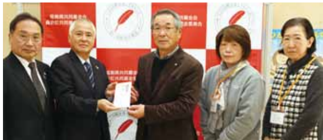
桑折町民生委員協議会様