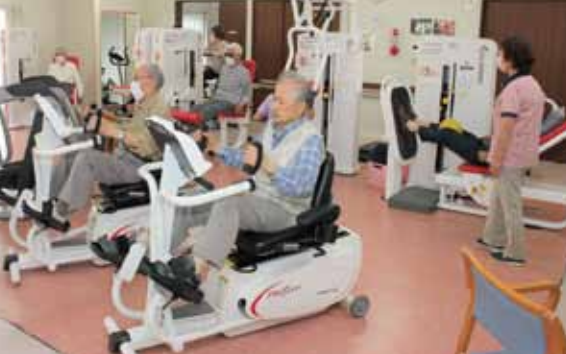
やすらぎデイサテライトもも