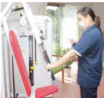
やすらぎデイサテライトもんも 機器消毒の徹底

職員、ご利用者の皆様がかからないよう、常日頃以上に消毒等の徹底を図っております。