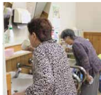
やすらぎ園デイ うがい・手洗いの徹底