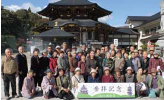
シニアいきいきのつどい (観光コース)