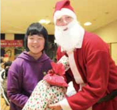
ふれあいデイサービス (クリスマス会)