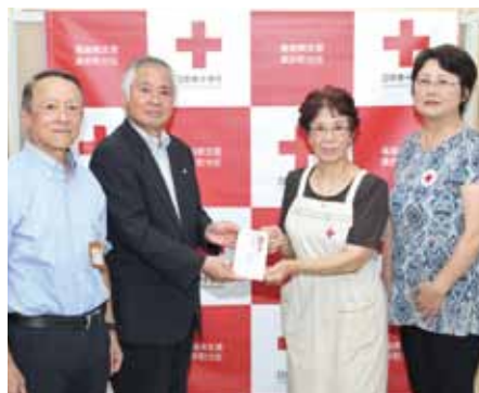
桑折町赤十字奉仕団 様