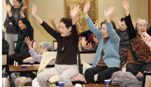
シニアいきいきのつどい (温泉コース)