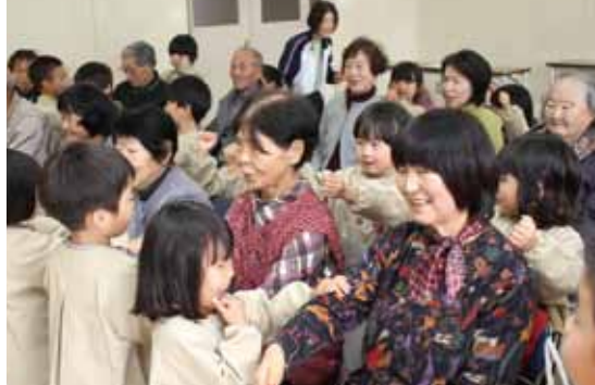
サロンと保育所交流会