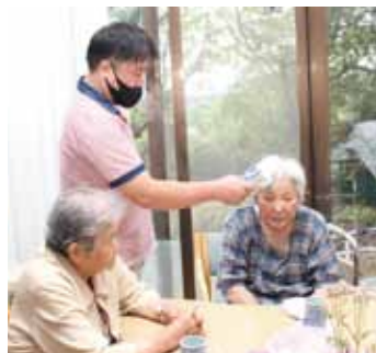
大かや園デイ 検温の徹底