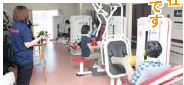
元気シニアクラブの様子

会員になったけど、いつの間にかやめてしまった、もう一度利用したい方もご連絡ください。