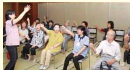
恒例のじゃんけん大会(昨年度の様子)