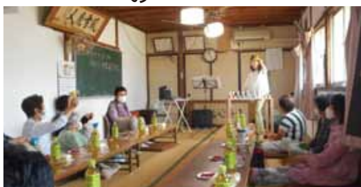
サロンの様子(南町きらく会)