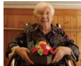
誕生日を迎える利用者へお花の贈呈