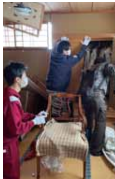
災害ボランティアセンター開設