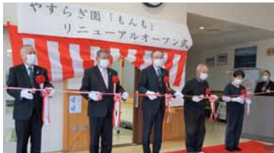
4月1日もんもリニューアルオープン