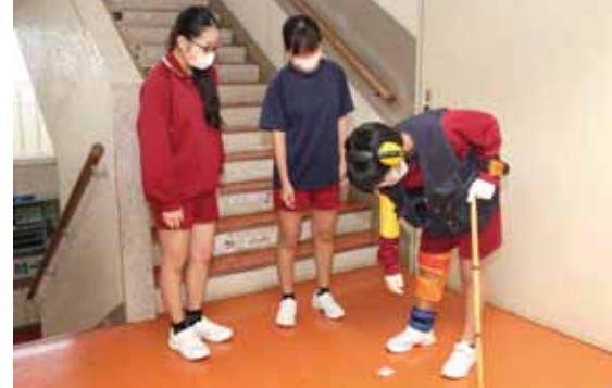
福祉の授業(睦合小)

※コロナウイルス感染症の影響により、当初の事業計画どおりに実施できなかった事業あり