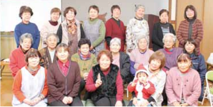
ふれあいいいきサロン 松原サロン