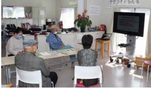
認知症オレンジカフェももんも