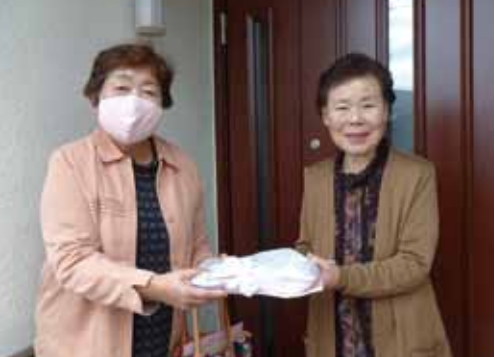
まごころ弁当配布事業