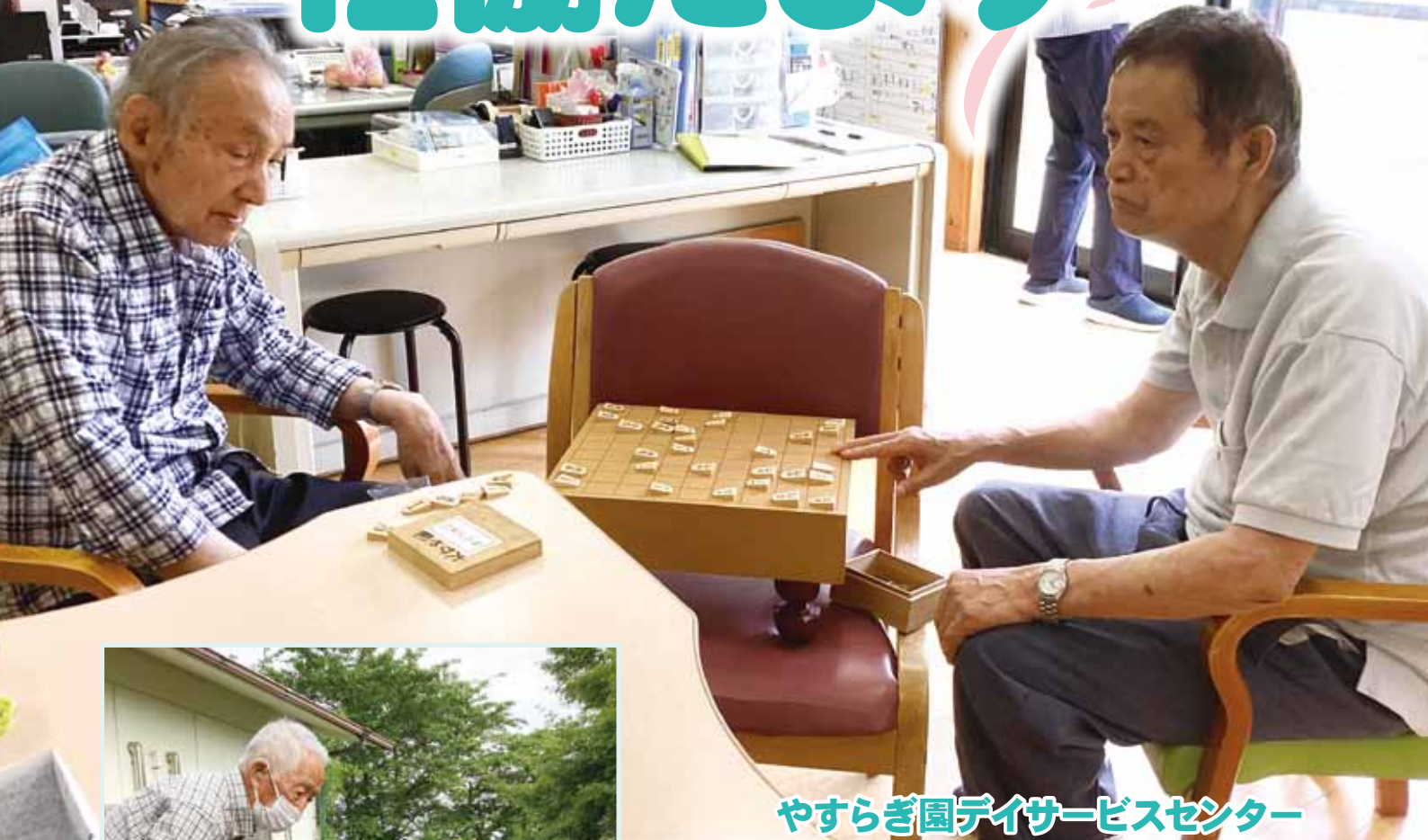
やすらぎ園デイサービスセンター