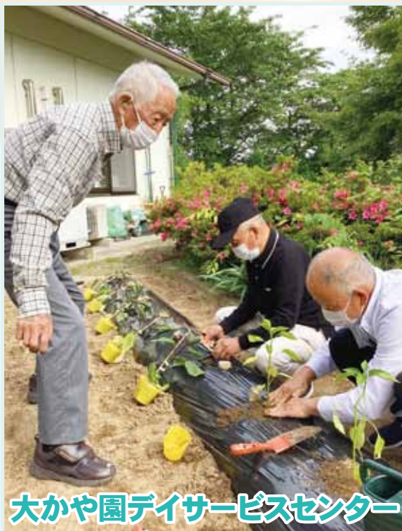
大かや園デイサービスセンター